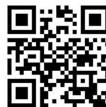
QR-Code zum Online-Nennformular

Unvollständige oder online übermittelte Nennformulare müssen spätestens bei der Dokumentenabnahme komplett unterschrieben werden. Die verbindliche Nennung zur Veranstaltung erfolgt über die Online-Nennung auf nennung.classique.de . Auf Wunsch lassen wir Ihnen das Nennformular als PDF-Datei per Email zukommen.