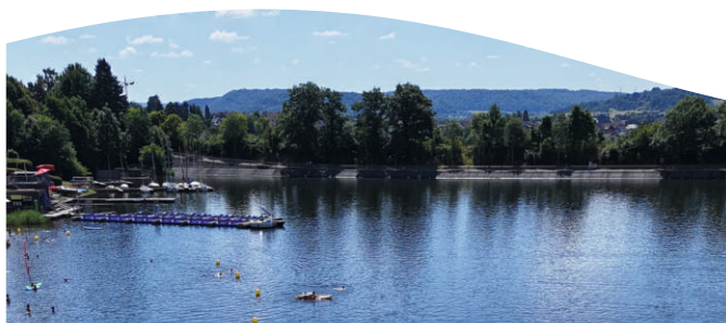
Aquapark 700qm 2

Klassen: Klasse 1 bis 1958 | Klasse 2 1959 – 1975 | Klasse 3 1976 – 1990 | Klasse 4 1991 – 2006